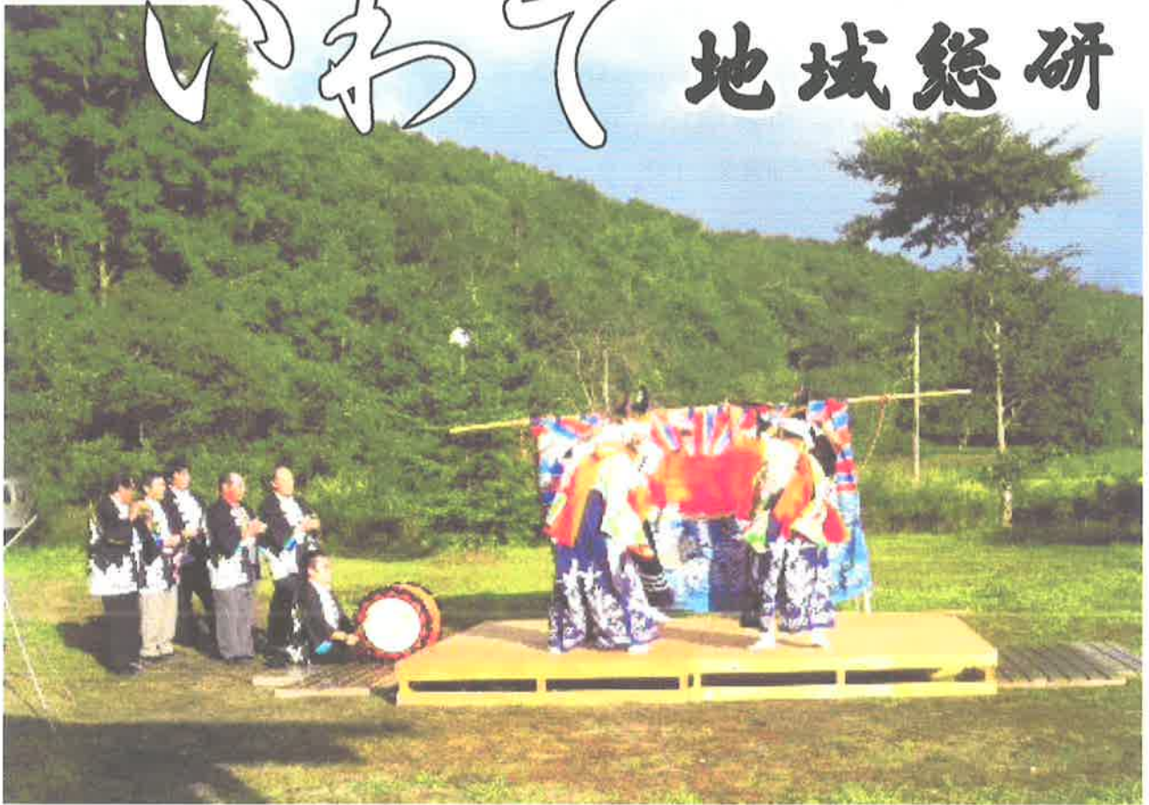
旧玉山村萩川(現盛岡市)「鶴舞い」